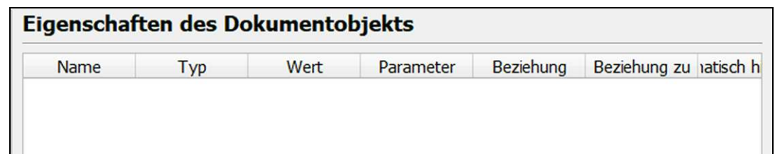
Abbildung: Das Fenster «Eigenschaften des Dokumentobjektes»