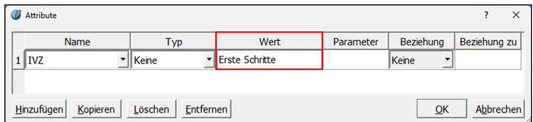
Abbildung: Das Fenster «Attribute»